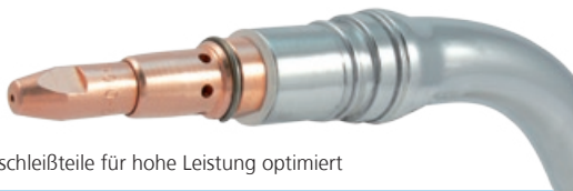
Verschleißteile für hohe Leistung optimiert

Anschluss Euro-Zentralstecker. Andere Anschlussmöglichkeiten sind auf Anfrage lieferbar.